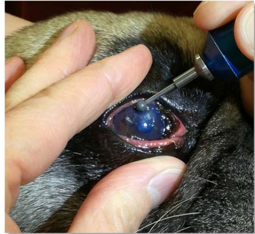
Abrasio (Abtragen der abgestorbenen losen Hornhautanteile) mit Diamantschleifer

Wichtig ist, dass vor der Behandlung andere Ursachen für einen Epitheldefekt, wie Distichien (Haare wachsen aus dem Lidrand und reiben auf der Hornhaut), Zilien (Haare wachsen aus der Lidbindehaut und reiben auf der Hornhaut), Entropium (das Lid rollt sich ein und die behaarte Haut reibt auf der Hornhaut) oder KCS (trockenes Auge) ausgeschlossen werden.