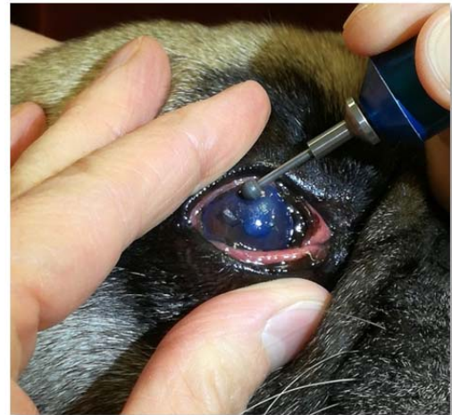
Abrasio (Abtragen der abgestorbenen losen Hornhautanteile) mit Diamantschleifer

Wichtig ist, dass vor der Behandlung andere Ursachen für einen Epitheldefekt, wie Distichien (Haare wachsen aus dem Lidrand und reiben auf der Hornhaut), Zilien (Haare wachsen aus der Lidbindehaut und reiben auf der Hornhaut), Entropium (das Lid rollt sich ein und die behaarte Haut reibt auf der Hornhaut) oder KCS (trockenes Auge) ausgeschlossen werden.