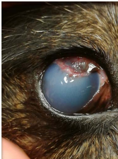
rechtes Auge 3 Wochen nach OP