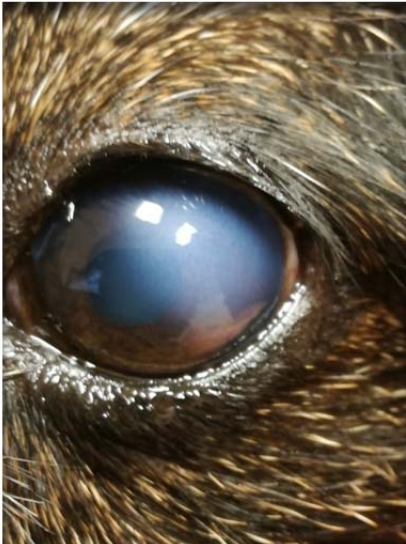
linkes Auge vor OP