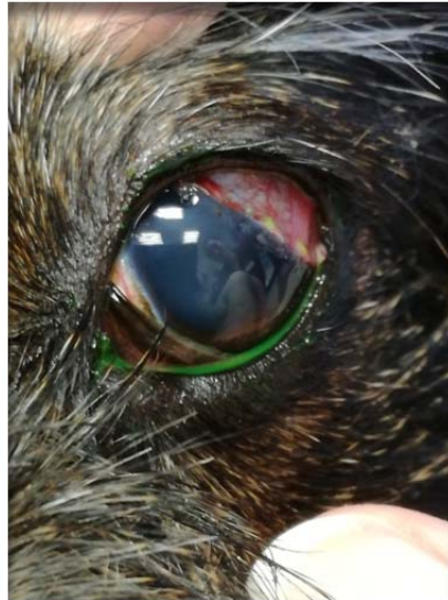
linkes Auge ein Tag nach OP