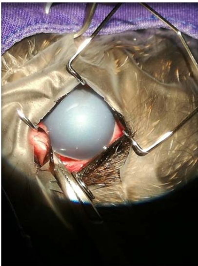
rechtes Auge vor OP